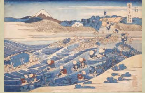
常設展 会期:平成28年6月10日(金)~7月24日(日) 「水辺の風景 一北斎・広重・国芳一」