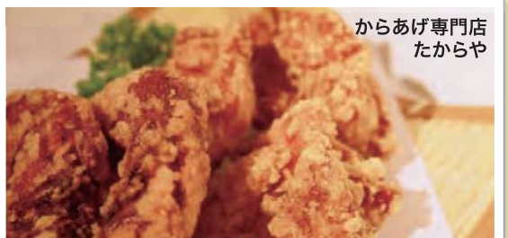
住所:堺市西区津久野町1-5-4 電話:072-271-6006 定休日:年始(1日・2日)