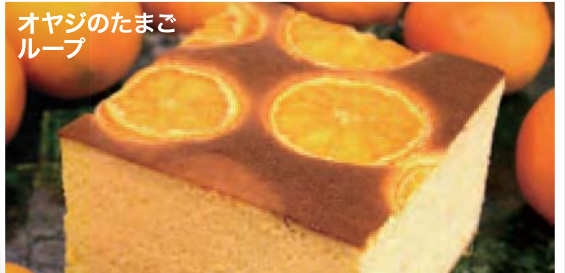
住所:和泉市納花町244-1 電話:0725-92-5582 定休日:火曜日