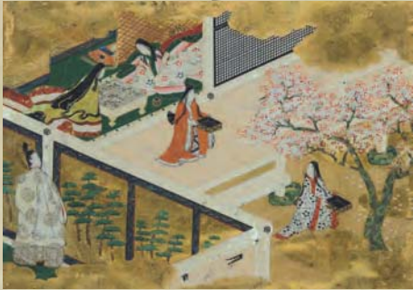
常設展 会期:平成28年2月11日(木 祝)~3月27日(日) 「源氏絵と和歌 一和のこころ」

源氏物語の世界をはなやかな絵で伝える源氏絵と、歌仙絵や歌絵、古筆切など和歌にちなんだ作品約50点を紹介します。伝統的なやまと絵の表現技法や、流麗な文字など、日本特有の優美さを備えた作品の鑑賞を通じて和の心を感じていただければ幸いです。