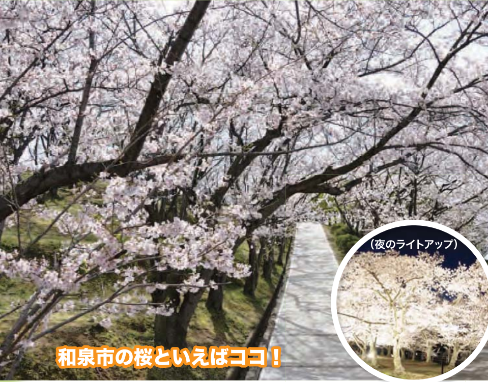
(夜のライトアップ)

住所:和泉市若樫町 ※桜は個人所有ですので見学の際はご注意ください。 なお狭小路にありますので公共交通機関をご利用ください。 交通:泉北高速鉄道と泉中央駅から南海バス「若樫」行き乗車「若樫」下車 3・4月は日・祝祭日運行の和泉市施設巡回バス(めぐ〜る)のご利用が便利です。 南部ルート乗車「若樫」下車