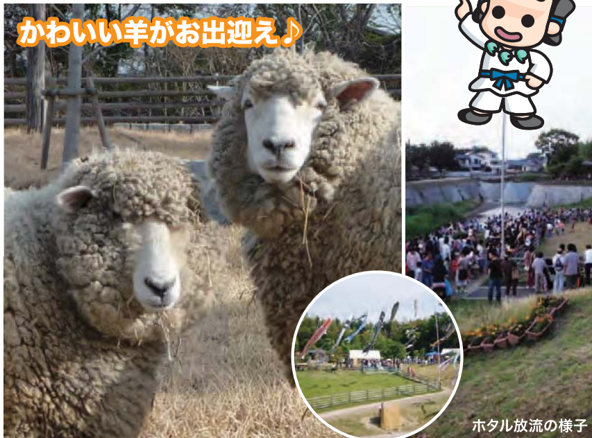
ホテル放流の様子