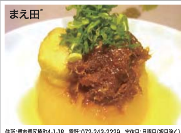
住所:堺市堺区橋町4-1-18 電話:072-243-2229 定休日:月曜日(祝日除く)

和泉市産の食材を使った全国に誇れるご当地グルメの発掘に向け、泉州地域の飲食店が集結する食のイベントの開催を今年も予定しております。市制施行60周年記念事業として、来場者も参加し、ギネス記録に挑戦するイベントも実施予定です。