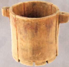
▲ 新時代の木製品(西念・南新保遺跡:金)