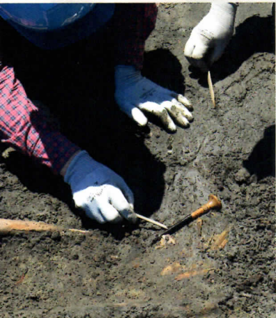
柄付き鉄製ヤリガンナの出土(八日市地方遺跡:石)

今からおおよそ三〇〇〇年前の弥生時代中期に最盛期を迎えた八日市地方遺跡は、後期に規模を縮小します。しかし、北陸では木製品や玉づくりの技術に変化がみられ、日本海がつかなく交流はますます活発になりました。そのような「八日市地方後」の技術・社会についてもあつかいます。日本海沿岸は近年、矢継ぎ早に新発見があり、弥生文化研究をけん引する今最も熱い場所です。当館夏の展示会では因幡(鳥取県東部)をテーマとしましたが、第2弾として北陸に取り組みます。日本海から新たなスタートを切る令和の弥生博にご期待ください！