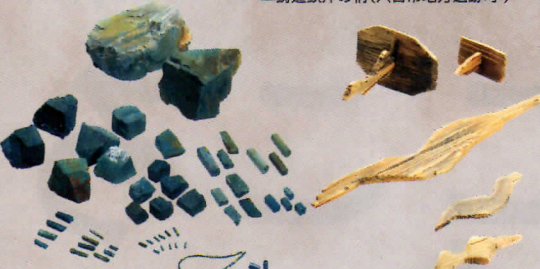
▲ 碧玉の玉づくり(八日市地方遺跡:小)