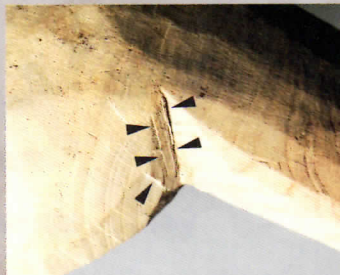
▲ 木製匙に残る鉄器の加工痕(八日市地方遺跡:小)