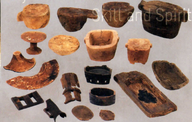
▲ さまざまな木製容器と製作途中品(八日市地方遺跡:小)