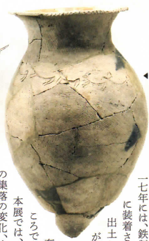
シカが描かれた壺 (八日市地方遺跡:小)

石川県小松市の八日市地方遺跡は北陸屈指の弥生時代の大集落。これまでの調査で、長期間にわたって繁栄した、ものづくりと交流の拠点だったことが明らかにされました。二〇一七年には、鉄製ヤリガンナが柄に装着された完全な形で出土したとのニュースがもたらされました。その大きな衝撃はまだ興奮冷めやらぬところです。