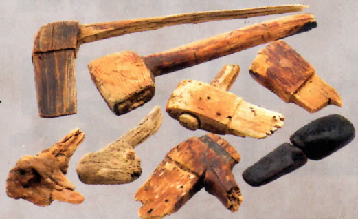
▲ 铸造鉄斧の柄(八日市地方遺跡:小)