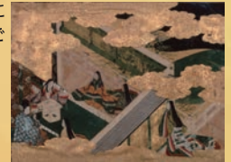
(重文)源氏物語手鑑 東屋一