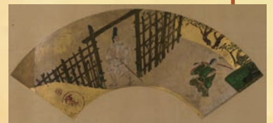
源氏物語 関屋図扇面 伝俵屋宗達筆