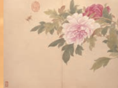
花卉画冊 鄒一桂筆

平成28年12月9日(金)～25日(日) 平成29年 1月5日(木)～29日(日)