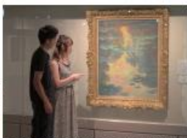
和泉市久保池記念美術館 クロード・モネ「睡蓮」