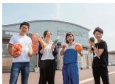
涼の駅いずみ山麓の堂