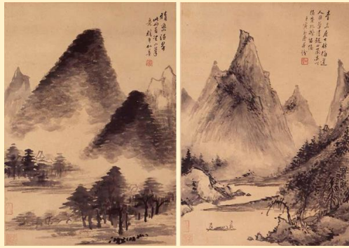
晴嵐湿翠図(左)・仿梅道人山水図(右) 金彩筆