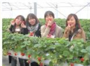
いずみふれあい農の堂 いちご狩り