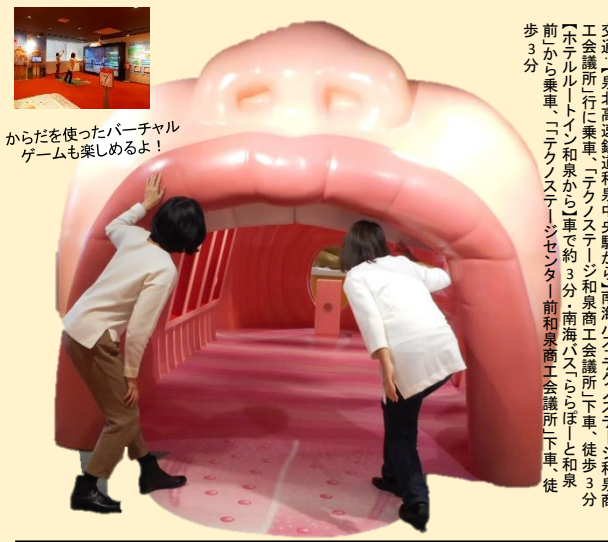
からだを使ったバーチャルゲームも楽しめるよ!

◆来館者数4万人を突破!! なたでも自由に来館いただける施設です。 2015年4月にオープンした食の安全や食育、たべるたいせつをテーマにした体験型施設。館内には食をテーマにしたクイズやスタンプラリー、体を使って遊ぶバーチャルゲームなどがあり、楽しみながら食について学べます。無料で開催している体験型のイベントは夏休み中の子どもの学習にも最適です。(イベントは、ホームページからの申し込みが必要です。) 住所: 和泉市テクノステーション三丁目1-3 (電話: 0725-01-001(組合員サービスセンター) 開館時間: 10時~16時(入館は15時30分まで) 定休日: 月曜日(祝日の場合は翌平日) 駐車場あり) 交通: 泉北高速鉄道と泉中央駅から「南海バス」テクノステーション和泉商工会議所前(徒歩3分)「ホテルトイン」和泉から徒歩約3分(南海バス)「和泉」前下車、徒歩3分