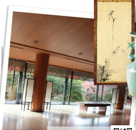
和泉市久保惣 記念美術館