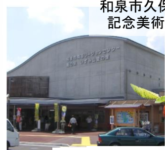
道の駅いずみ 山愛の里