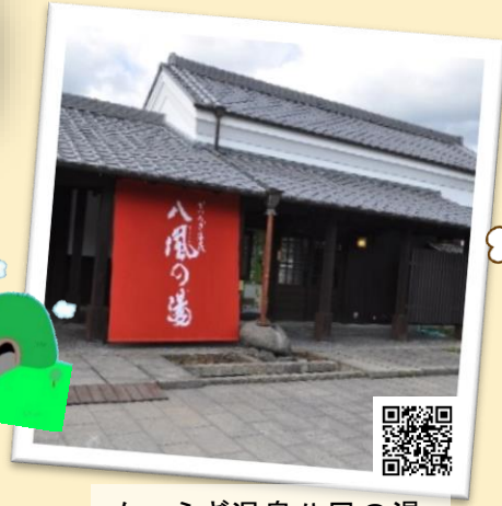
かつらぎ温泉八風の湯