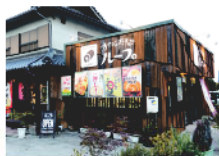
和泉のおいちごさん ハーフ926円