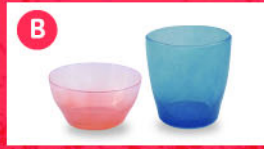
B 吹きガラス工房fresco solito bowl×2個 & solito glass×2個

生活の中に空気や光を意識させる、ガラスのボウルとグラスのセット。色は選べません。