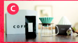
C TSUJIMOTO COFFEE すてきなじかん おうちカフェスターセット

生活の中に空気や光を意識させる、ガラスのボウルとグラスのセット。色は選べません。