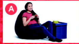
A yogibo Yogibo Lounger(1人用ソファ)