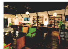
いずみのみるくいちごサンド 800円