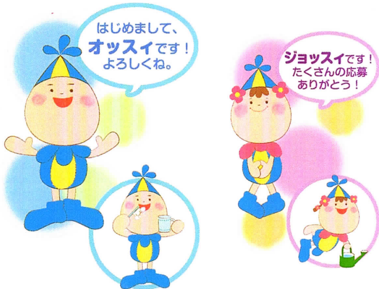
上下水道 イメージキャラクター

ロマンちゃん イズミ国の清らかな水を司る巫女。 紀元前52年生まれてコダイくんと同じ年の16歳。 手に持つ稲穂はイズミ国の豊穡の証し。 顔に似合わず、ちょっと気が強い・・・かも。