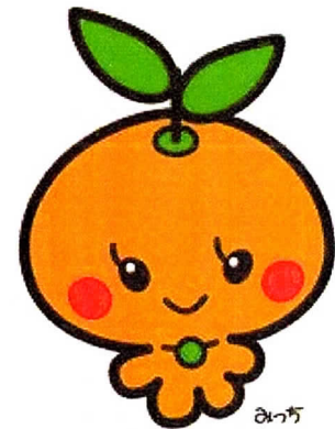
和泉みかん みつち