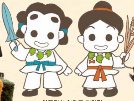
이즈미시 이미지 캐릭터 고다이 군·로만 짱

2000년 전에 번영했던 '이즈미 나라'에서 온, 기원전 52년생 2인조. 이즈미 나라의 왕자인 고다이 군은 사랑을 지키는 상징이자 선조로부터 전해 내려온 동경 '이케소네노 쓰루기'를, 물을 관장하는 무너 로만 짱은 풍작을 나타내는 벼 이삭을 가지고 있다.