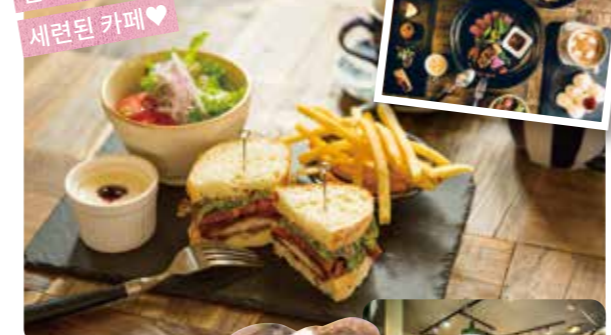
인기 있는 런치 외에 모닝과 디저트도 훌륭한 맛