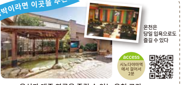
숙박이라면 이곳을 추천! 온천은 당일 입욕으로도 즐길 수 있다

access 시노다야마역에서 걸어서 2분 0725-46-1111 체크인 14:00 체크아웃 10:00 비정기 휴무 이즈미시 이케가미초 1-696-1 http://yayoi-asuka.com/