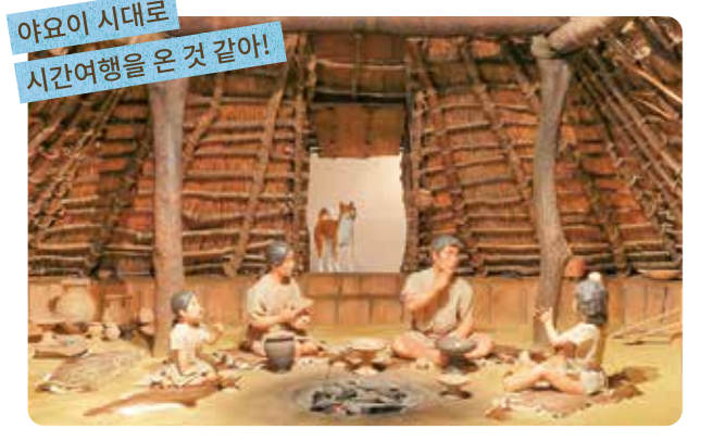
야요이 시대로 시간여행을 온 것 같아!

access 시노다야마역에서 걸어서 10분 0725-46-2162 9:30-17:00(최종 입장 16:30) 월요일(공휴일의 경우에는 다음날 휴무), 연말연시 이즈미시 이케가미초 4-8-27 http://www.w.kanku-city.or.jp/yayoi/