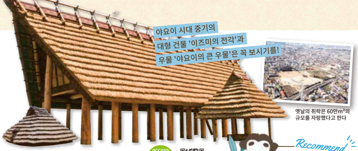
야요이 시대 중기의 대형 건물 '이즈미의 전각'과 우물 '야요이의 큰 우물'은 꼭 보시기를!

유적 탐방과 지방 산업의 크래프트 체험이 다양하게 준비되어 있고, 이즈미시의 역사를 다이제스트로 즐길 수 있는 북부 지역. 여행의 마무리로 천연온천을 즐기는 것도 최고!