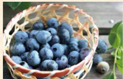
F 이즈미 후레아이 노노사토