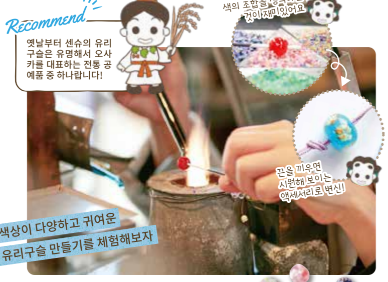
옛날부터 센수의 유리구슬은 유명해서 오사카를 대표하는 전통 공예품 하나랍니다!