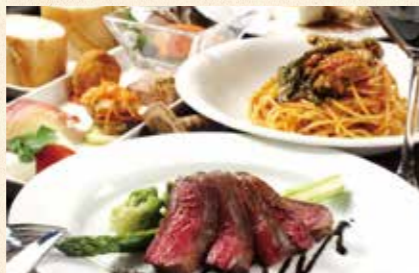
L trattoria Luciano

옛날에 '이즈미의 나라'로 변명했던 이즈미시. 그 장대한 역사 로망과 풍요로운 자연으로 둘러싸인 이곳은 모두를 꼭 빠지게 할 매력이 가득하다. 2000년 전의 유적을 돌아보는 역사 투어, 장인의 기술을 체험할 수 있는 공방, 산들과 태양의 기운을 듬뿍 받고 자란 농산물을 수확 체험할 수 있는 농원 등 이곳에서만 가능한 특별한 체험이 기다리고 있다. 자, 마음 설레는 체험을 하러 이즈미시로 떠나보자.