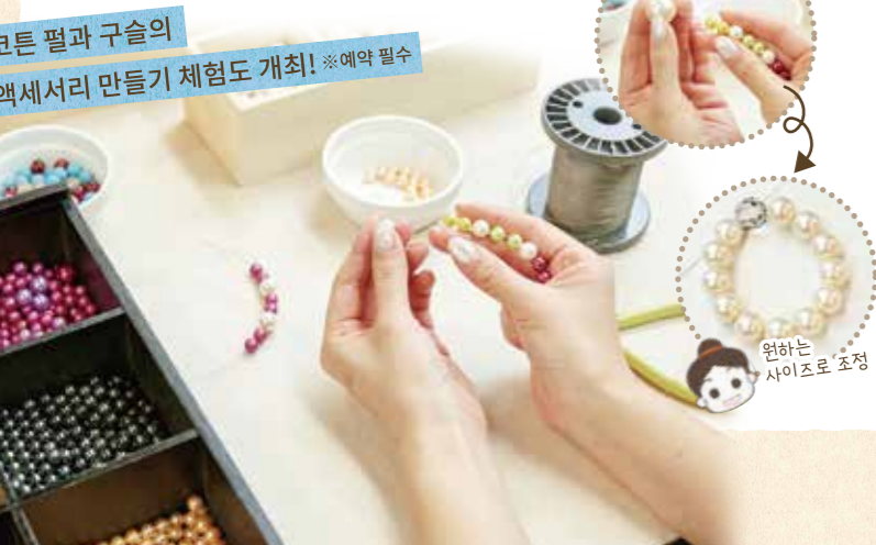
코튼 필과 구슬의 액세서리 만들기 체험도 개최! ※예약 필수

E 음식과 대중 연극을 즐길 수 있는 온천 료칸 야요이노사토 온천 장수 온천이라고 일컬어지는 나트륨 염화물천의 천연 온천이 솟아나는 곳. 맛있는 가이세키 요리와 대중 연극을 즐길 수 있는 점도 매력.