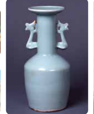
(국보)청자 봉황 모양 병 명만성