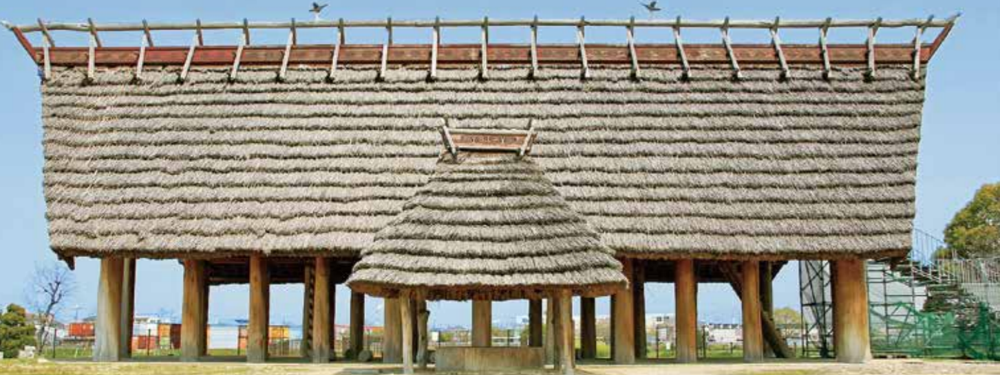
A 이케가미소네 사적 공원