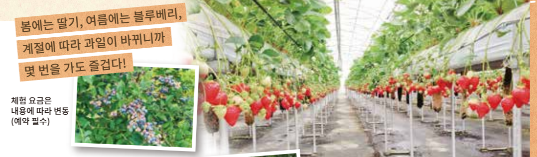
봄에는 딸기, 여름에는 블루베리, 계절에 따라 과일이 바뀌니까 몇 번을 가도 즐겁다!

자연이 풍요로운 남부 지역은 오사카 굴지의 과일의 산지. 계절의 과일 수확 체험과 예술적인 명소를 돌아보며 신나게 즐기자!